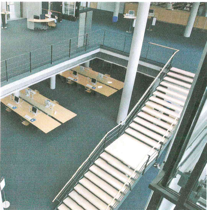
Der neue Boden fügt sich in das farbliche Design des Gebäudes.

Produkt: Webware Wilton Profile (strukturierte Webschlinge in Ripsoptik)